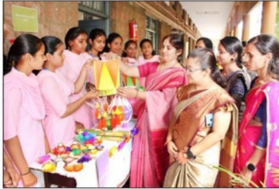
ಜೊತೆಗೆ ಉತ್ತಮ ಬದುಕನ್ನು ನಡೆಸಲು ಉದ್ಯೋಗ ಉದ್ಯೋಗವನ್ನು ಸೃಷ್ಟಿಸಿಕೊಳ್ಳಲು ಸಾಧ್ಯವಾಗುತ್ತದೆ.

ಶೈಕ್ಷಣಿಕವೆಂದರೆ ಕೌಶಲ್ಯವನ್ನು ಕಲಿಸುವುದು ಮಾತ್ರವಲ್ಲದೆ ಅದನ್ನು ಹೇಗೆ ಬಳಸಿಕೊಳ್ಳಬೇಕೆಂದು ಕಲಿಸುವುದು. ಈ ವೇಗದ ಅತ್ಯಂತ ಸ್ಪರ್ಧಾತ್ಮಕ ಜಗತ್ತಿನಲ್ಲಿ, ವಿದ್ಯಾರ್ಥಿಗಳು ಒಂದು ಅವಧಿಯಲ್ಲಿ ಕಲಿಕೆ ಮತ್ತು ಅಭ್ಯಾಸ ಮಾಡುವ ಕೌಶಲ್ಯಗಳ ಮೇಲೆ ಬದುಕುವ ಸಾಮರ್ಥ್ಯವನ್ನು ಹೊಂದಿರಬೇಕಾಗಿದೆ. ವಿದ್ಯಾರ್ಥಿನಿಯರು ತಮ್ಮ ಕಲಾ ಹಂತದಲ್ಲಿ ಈ ರೀತಿ ವ್ಯಾಪಾರದ ಕೌಶಲ್ಯವನ್ನು ಬೆಳೆಸಿಕೊಳ್ಳುವ ಇದರಿಂದ ನಿಮ್ಮಲ್ಲಿರುವ ಕೌಶಲ್ಯವು ಅಭಿವೃದ್ಧಿಯಾಗುವವರೆಗೆ